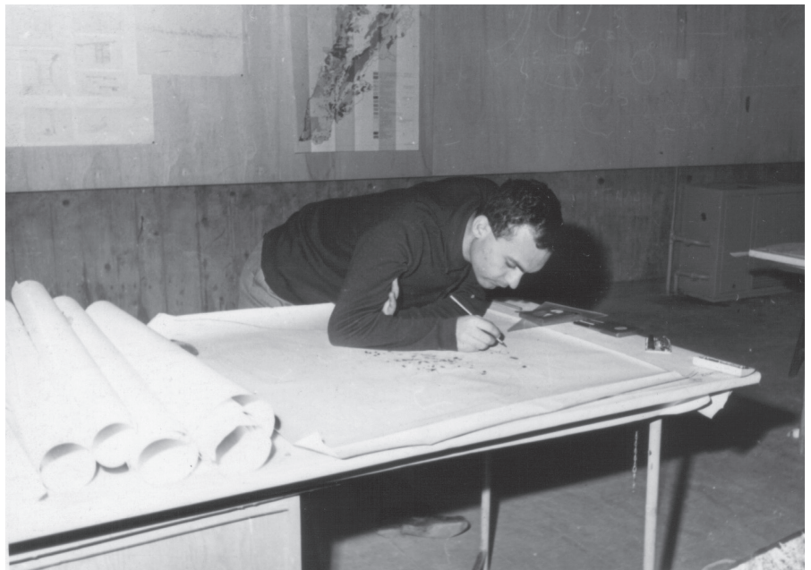
ODTÜ'de öğrencilik yılları (1958-1962), stüdyoda çalışırken.