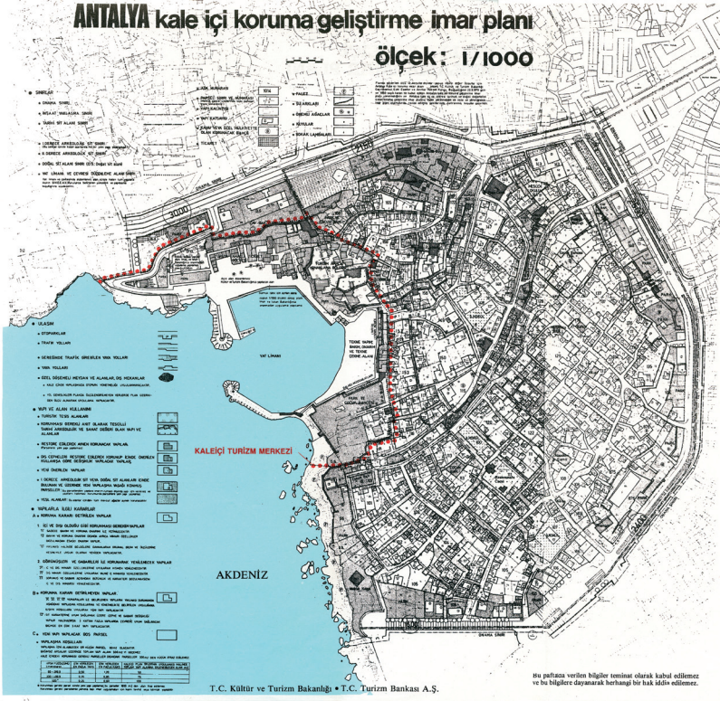
1. MAKAL, M. (2000) Bozkırdaki Kıvılcım , Güldikeni Yayınları, Ankara.

ülkelerde de uygulanmakta olduğu bilinmektedir.